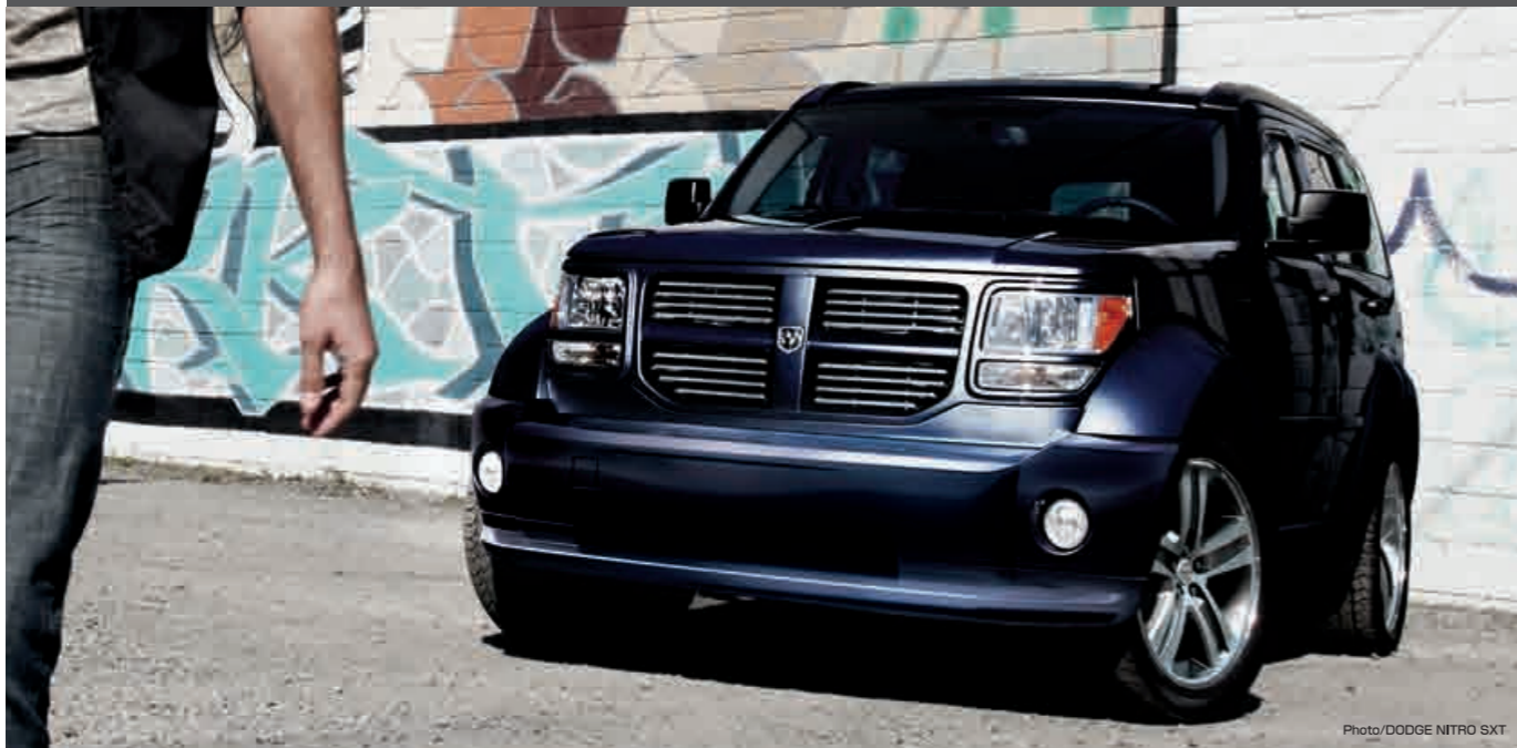
Photo/DODGE NITRO SXT